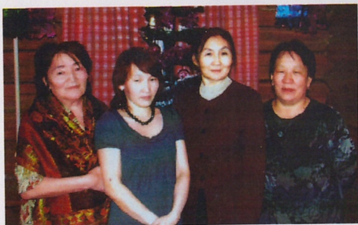
Кырыкый ФАП-ын коллектива