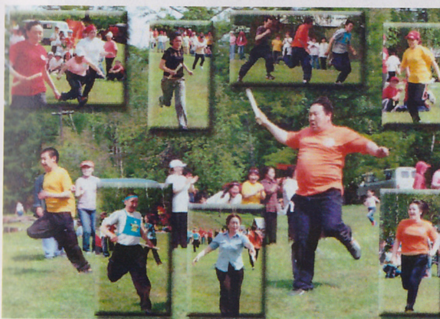
Эмп үлэһиттэрин спартакиадата