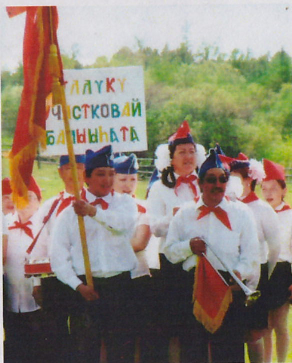
Эмн үлэһиттэрин күнэ. Эдэр пионердар