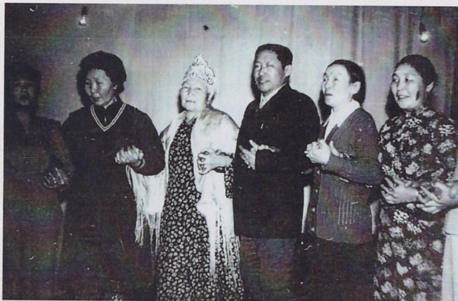
Кулуунка концерт кэмигэр