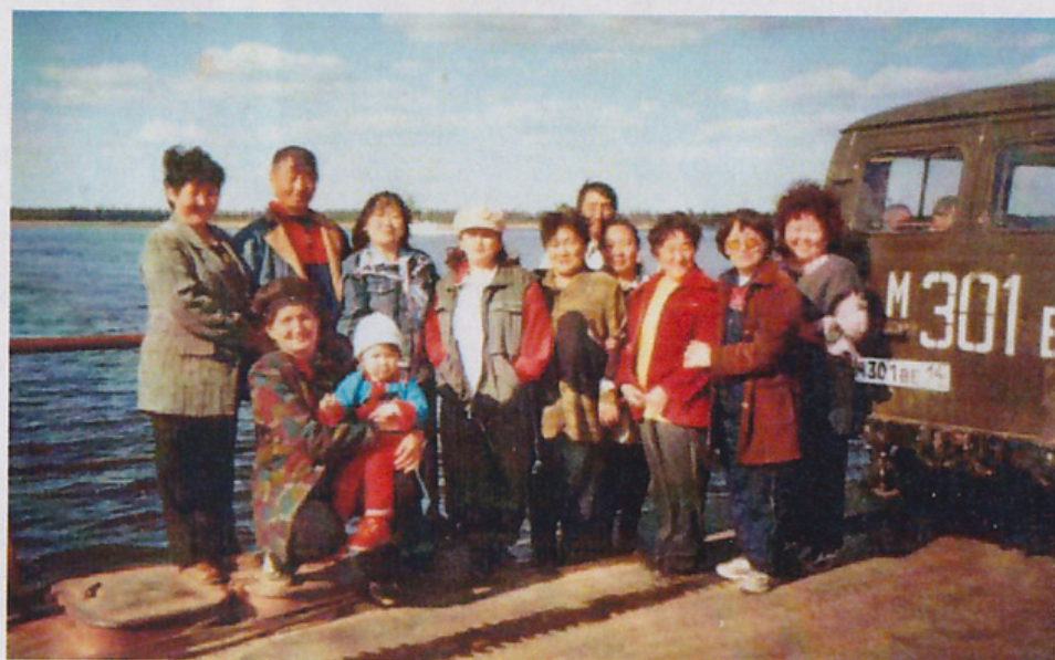
Бүлүү өрүһү паромунан туорааһын